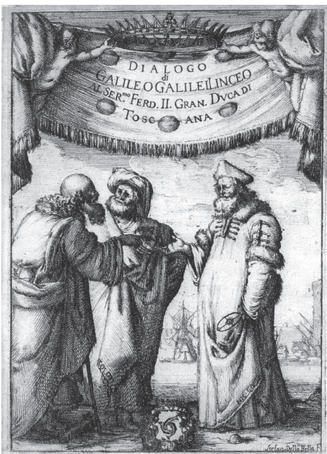
Abb. 1: Titelblatt von Galileis Dialog: Aristoteles, Ptolemäus und Copernicus diskutieren